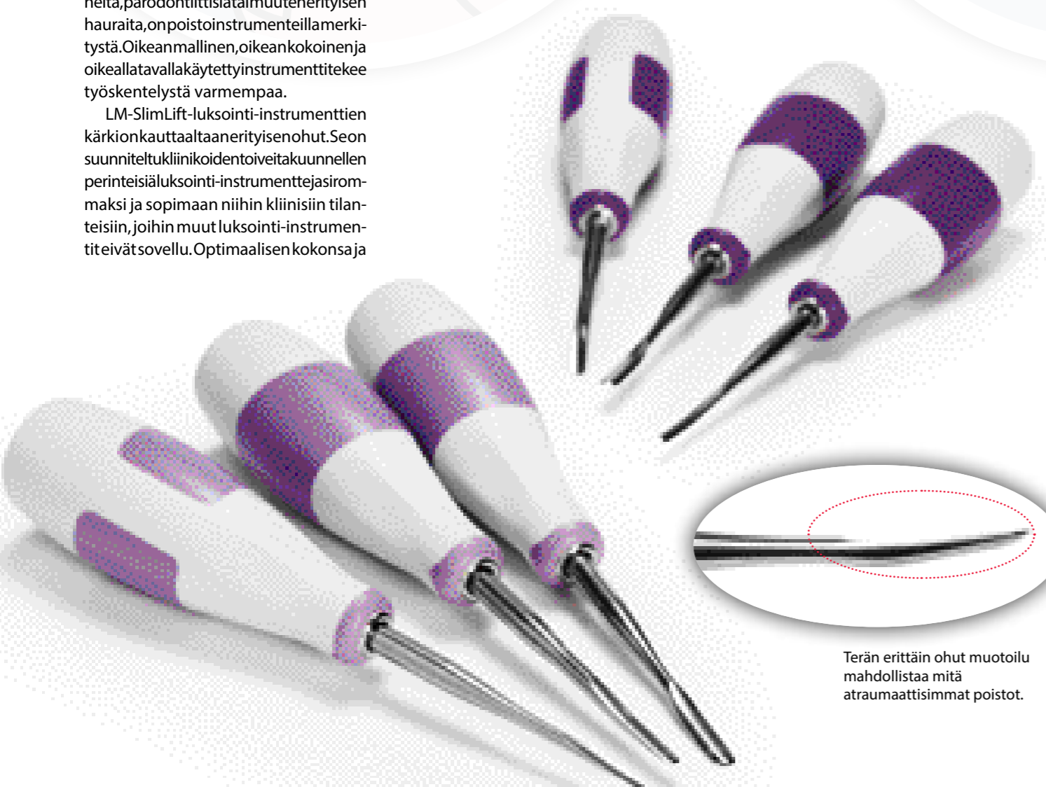
Terän erittäin ohut muotoilu mahdollistaa mitä atraumaattisimmat poistot.